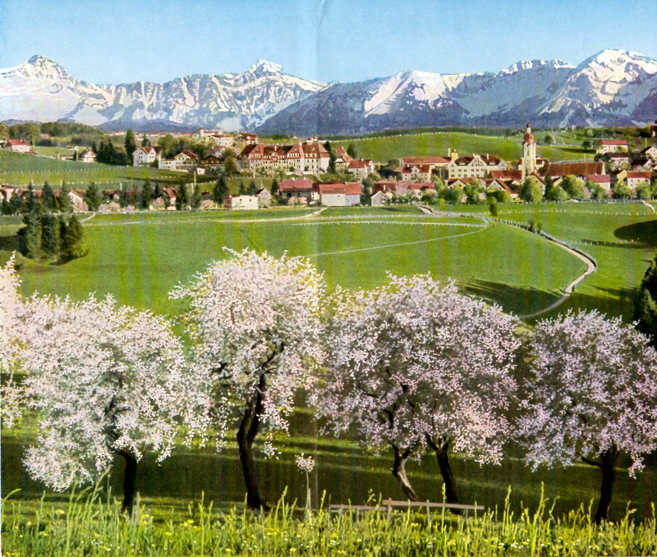
SCHEIDEGG IM FRÜHLING