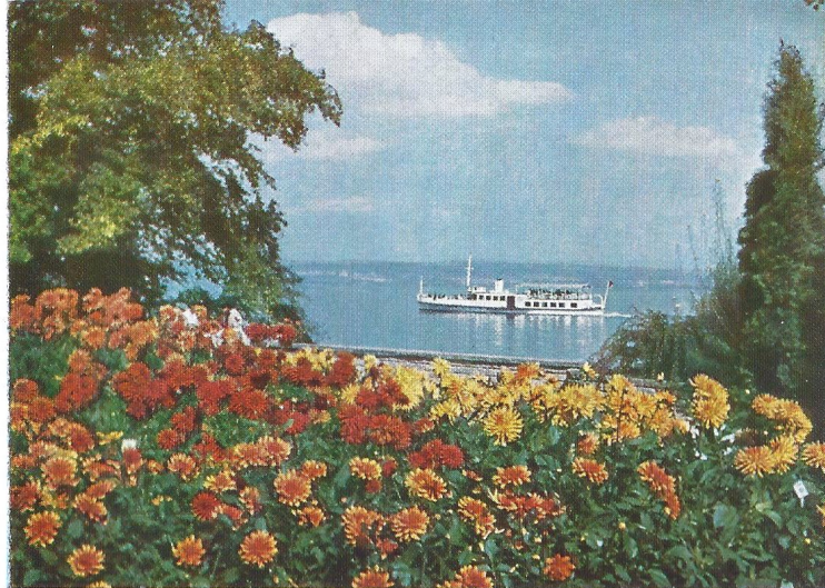
Hybrid- und Kaktusdahlien leuchten wie untergehende Sonnen