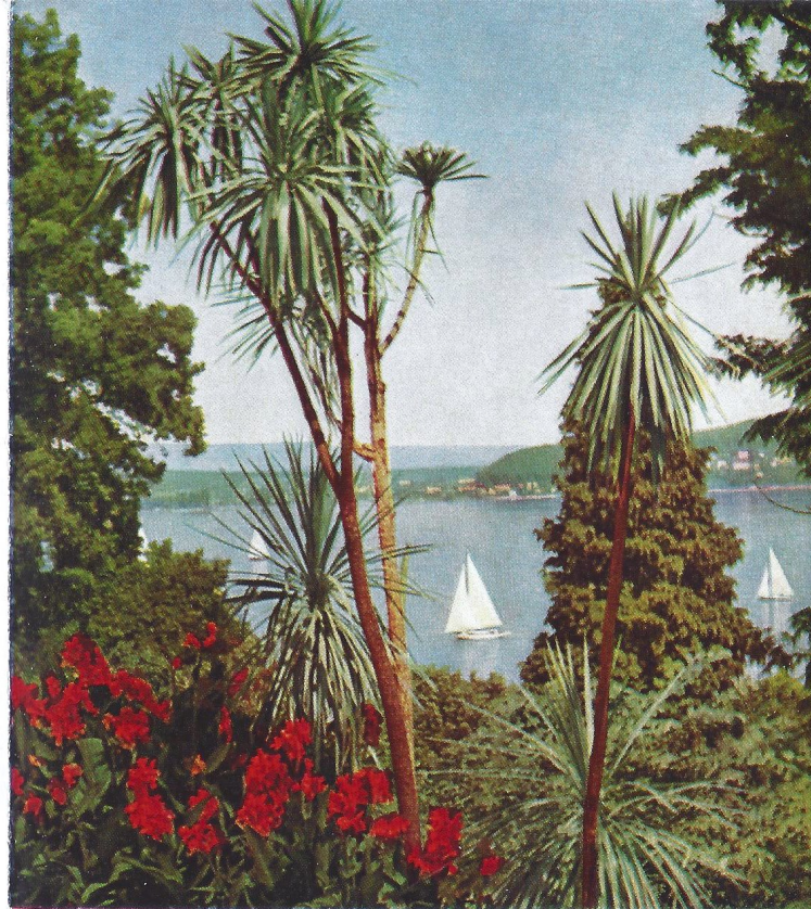
Malerischer Ausblick durch Drazänen auf Kloster Birnau und Uhldingen

War die Mainau als Sommerresidenz des Großherzogs Friedrich I. von Baden mit der Fülle ihrer dendrologischen Kostbarkeiten und der Blüte des Rosengartens hinreichend umschrieben, so hat sich ihr weiterer Ausbau zu einer Park- und Blumeninsel unter der Betreuung von Graf Lennart Bernadotte vollzogen.