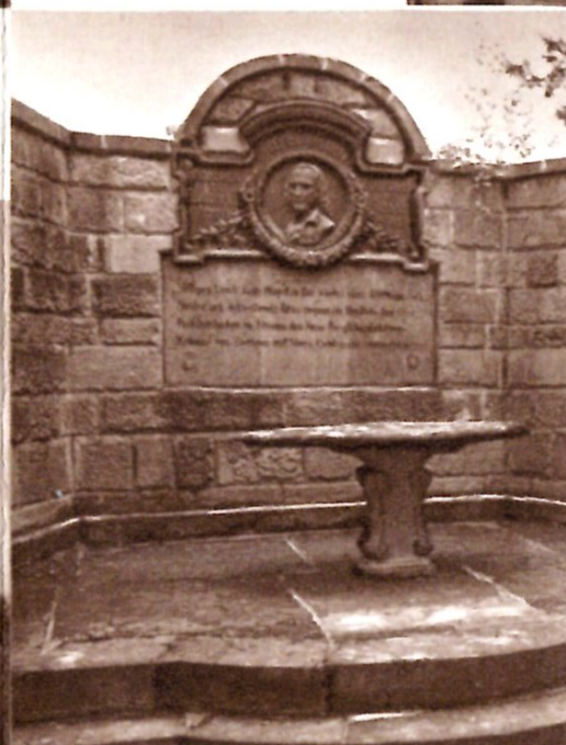
Hölderlins Gedächtnisstätte im Klostergarten

Nach all diesem finden sich in dieser gastfrohen Stadt zahlreiche Einkehrmöglichkeiten (siehe Beiprosppekt). Restaurierte Betriebe überraschen mit Spezialitäten und der würzige Laufener Trollinger, Sylvaner und Riesling, beleben Gemüt und bringen frohen Mut und Freuden. Ein Besuch in der 1936 erbauten, völlig neuzeitlichen Kelter, hat noch jeden begeistert. Ob im Frühjahr, Sommer oder Herbst, wenn schwer beladene Wagen die Ernte der Rebenhalden zu Tale bringen, lohnt sich ein Besuch der romantischen Weinstadt Lauffen.