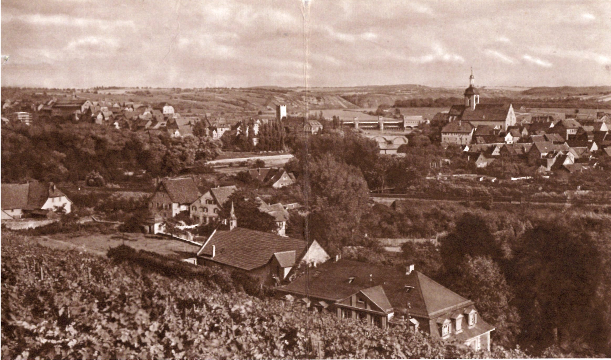
Ausschnitt aus der Gesamtansicht mit Blick auf Reginwindiskirche und Rathaus mit dem Stausee