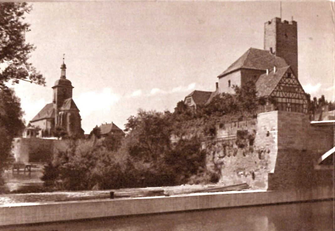
Auf hoher Bastei über dem Neckar grüßen Reginswindiskirche und Rathaus

Die Wasserburg, heute das Rathaus, vom linken Neckarufer aus gesehen