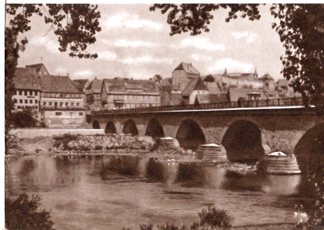
Alte Neckarbrücke mit „Städtle“