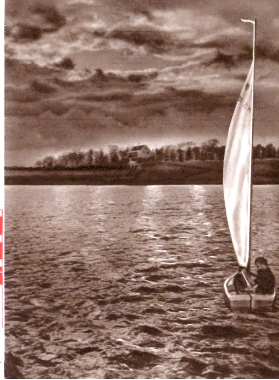
Abendstimmung am Stausee

Reich ist die Geschichte Lauffens. Abgesehen von vielen vorgeschichtlichen und römischen Funden wird Lauffen schon unter den Karolingern als Königsgut genannt. Als Stadt wird sie bereits 1234 erwähnt. 1534 entschied die Schlacht bei Lauffen über die Reformation in ganz Württemberg.