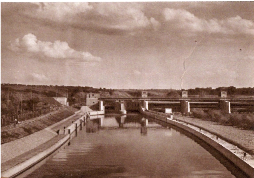
Großschiffahrtskanal mit Schleuse und Staudamm