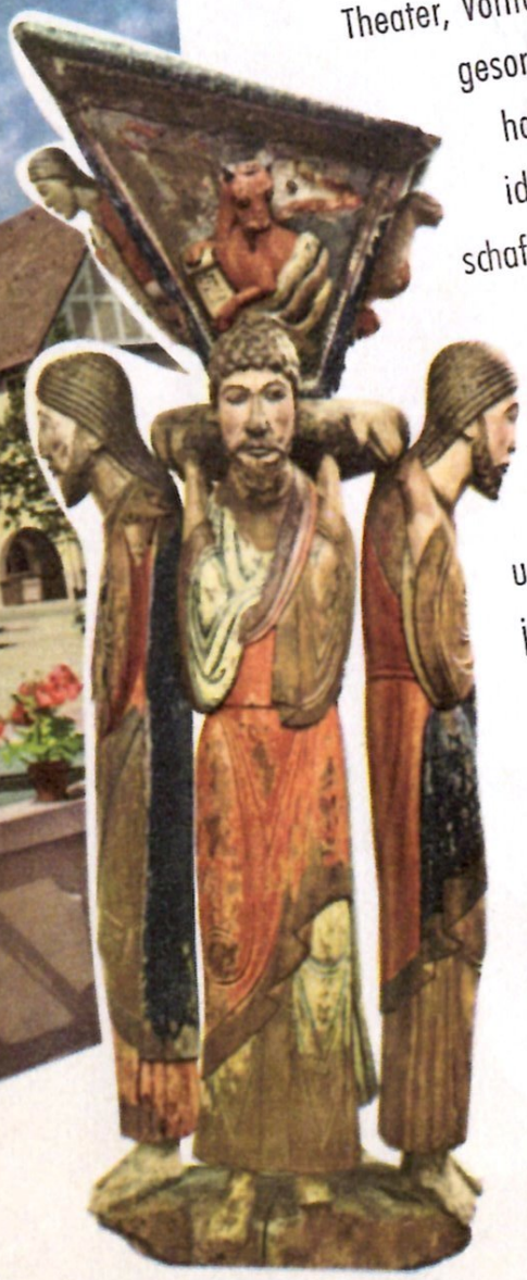
Die neue Stadt