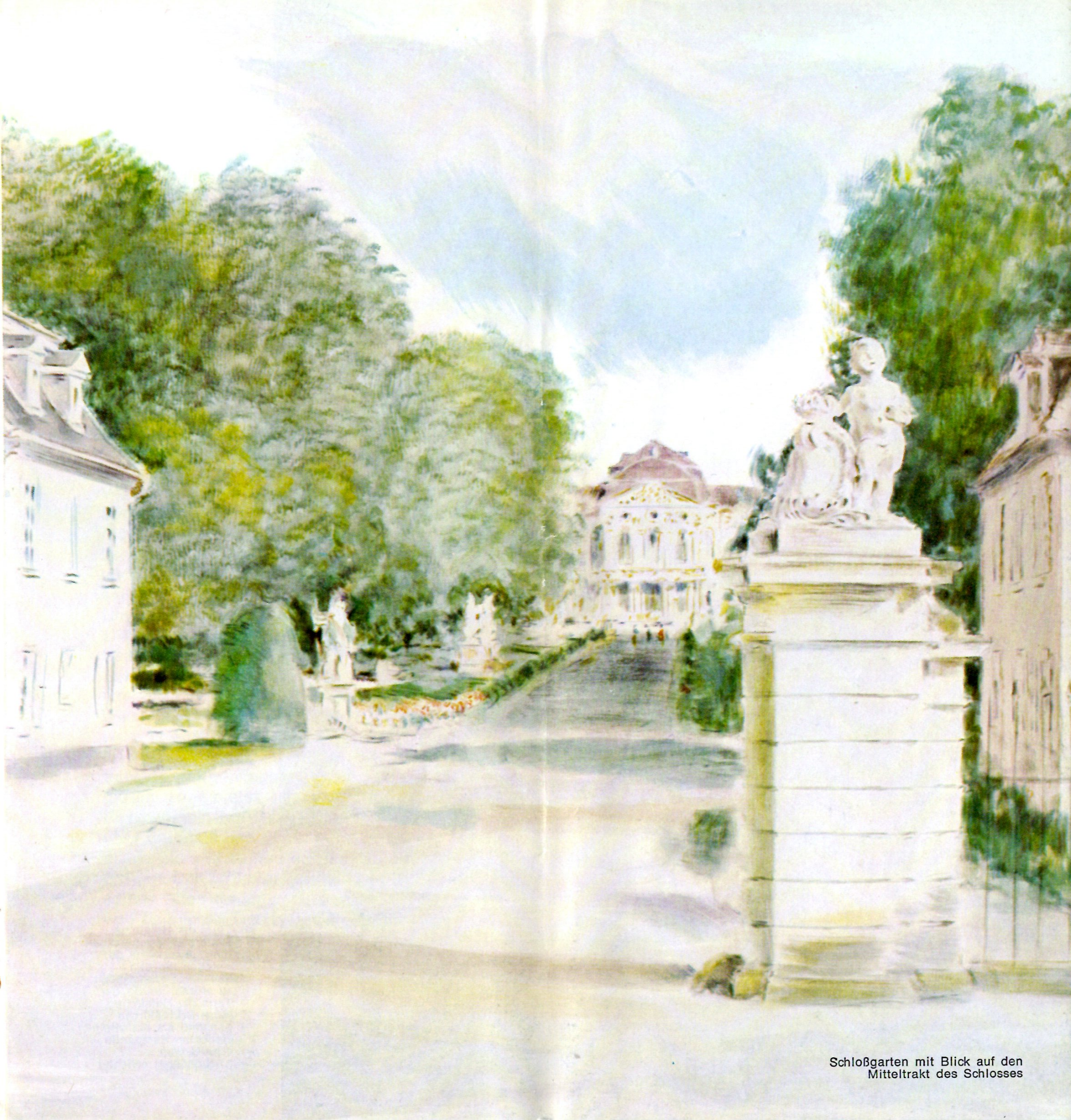
Schloßgarten mit Blick auf den Mitteltrakt des Schlosses