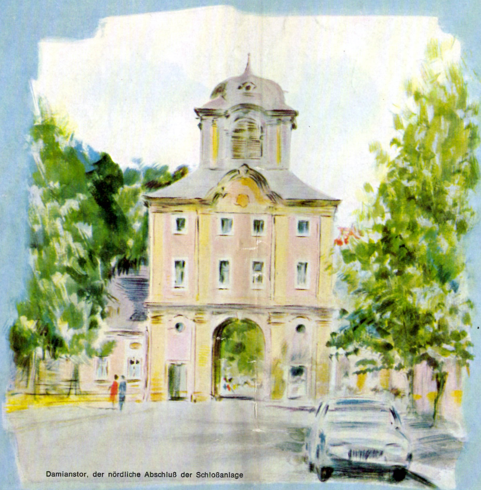
Damiansturm, der nördliche Abschluß der Schloßanlage

Herausgegeben vom Verkehrsverein Bruchsal e. V. — Geschäftsstelle im Rathaus, Telefon 2541 — in Verbindung mit dem städt. Verkehrsamt · Aquarelle und Zeichnungen: Egon Plamper, Wolfartsweiler · Fotos: Robert Häusser, Mannheim (9), Alfred Wiedemann (2) · Text: Hans Stauder · Gestaltung: Kunibert Hettmannsperger Klischees: W. Riegger, Karlsruhe · Herstellung: Stork Druck Bruchsal · Printed in Germany · Imprimé en Allemagne · Schutzgebühr: DM —,20 · 4. 67 30