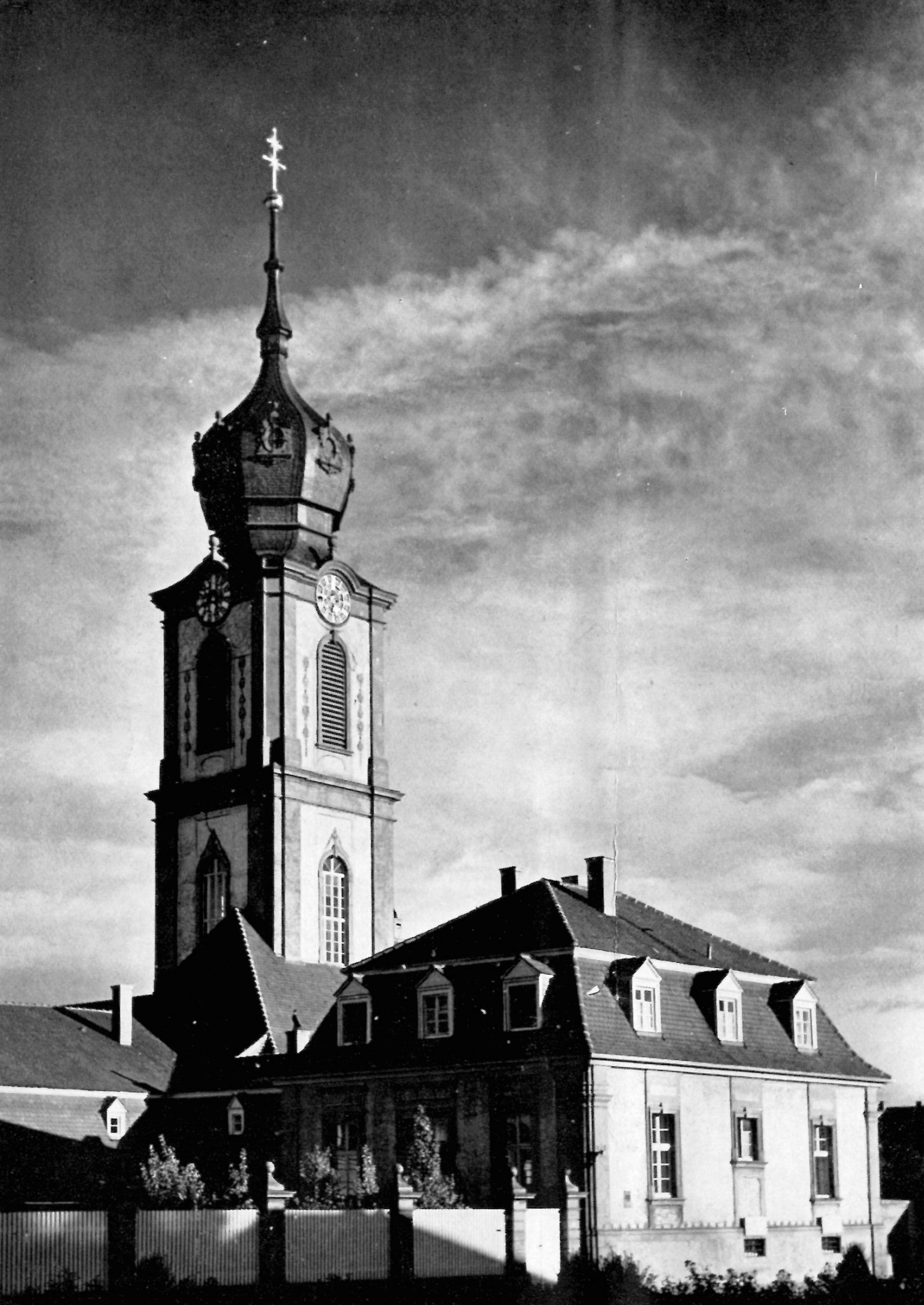
◀ Turm der Hofkirche. Um die streng durchgeführte Symmetrie der Anlagen um den Schloßhof herum nicht zu stören, wurde der Turm der Hofkirche (auch Schloßkirche genannt) als ein allein-stehender Campanile abseits vom Kirchenflügel errichtet