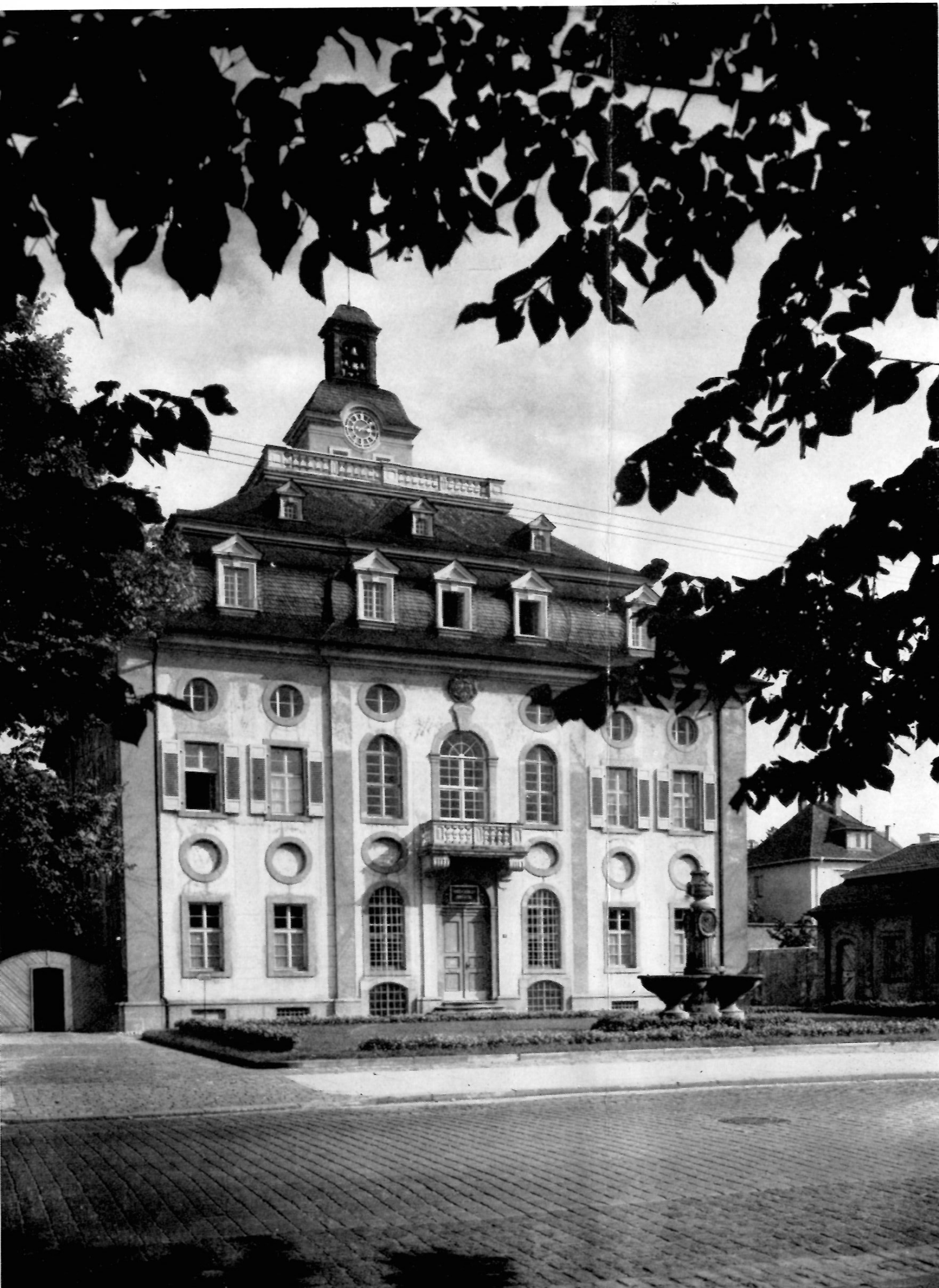
◀ Das Amtsgericht, früher Kanzlei­gebäude der Schloßanlage, von dessen Uhr­turm nach dem Vorbild von 1772 zu be­stimmten Tageszeiten wieder ein Glockenspiel als steter Kün­der und Mahner an die Schönborn-Huttenzeit mit Melodien aus dem 18. Jahrhun­dert erklingt. Davor steht zur Erinnerung an die letzte Bewoh­nerin des Schlosses, Mark­gräfin Amalie von Baden, der Amalienbrunnen