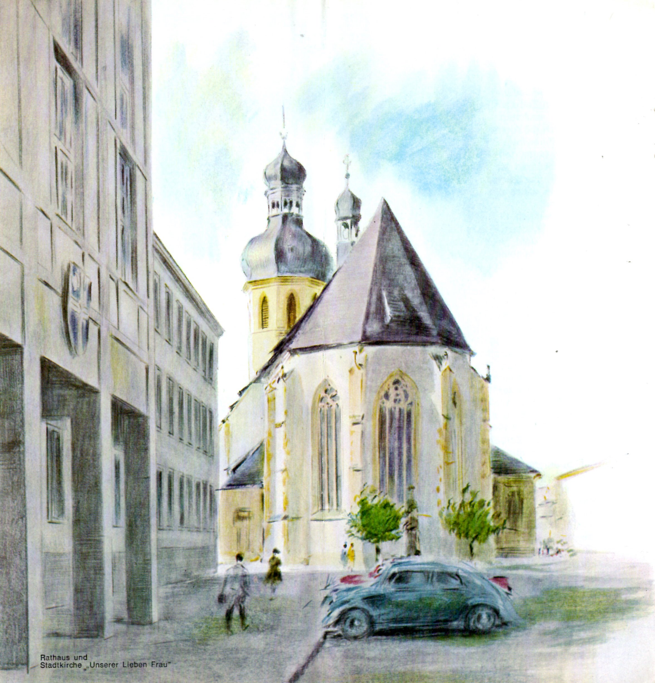
Rathaus und Stadtkirche „Unserer Lieben Frau“