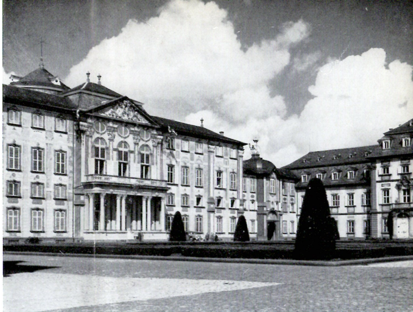
Wiedererstandener Kammermusiksaal im Schloß ▶

In alter „Pracht und Herrlichkeit“ entsteht jedoch nur der Haupttrakt, das Corps de Logis mit dem „Gartensaal“, dem Neumannschen Treppenhause, dem Kuppelsaal, dem Fürsten- und Marmorsaal. Die Monumentalgemälde an Decken und Wänden, die Stukturen in reicher Fülle, werden