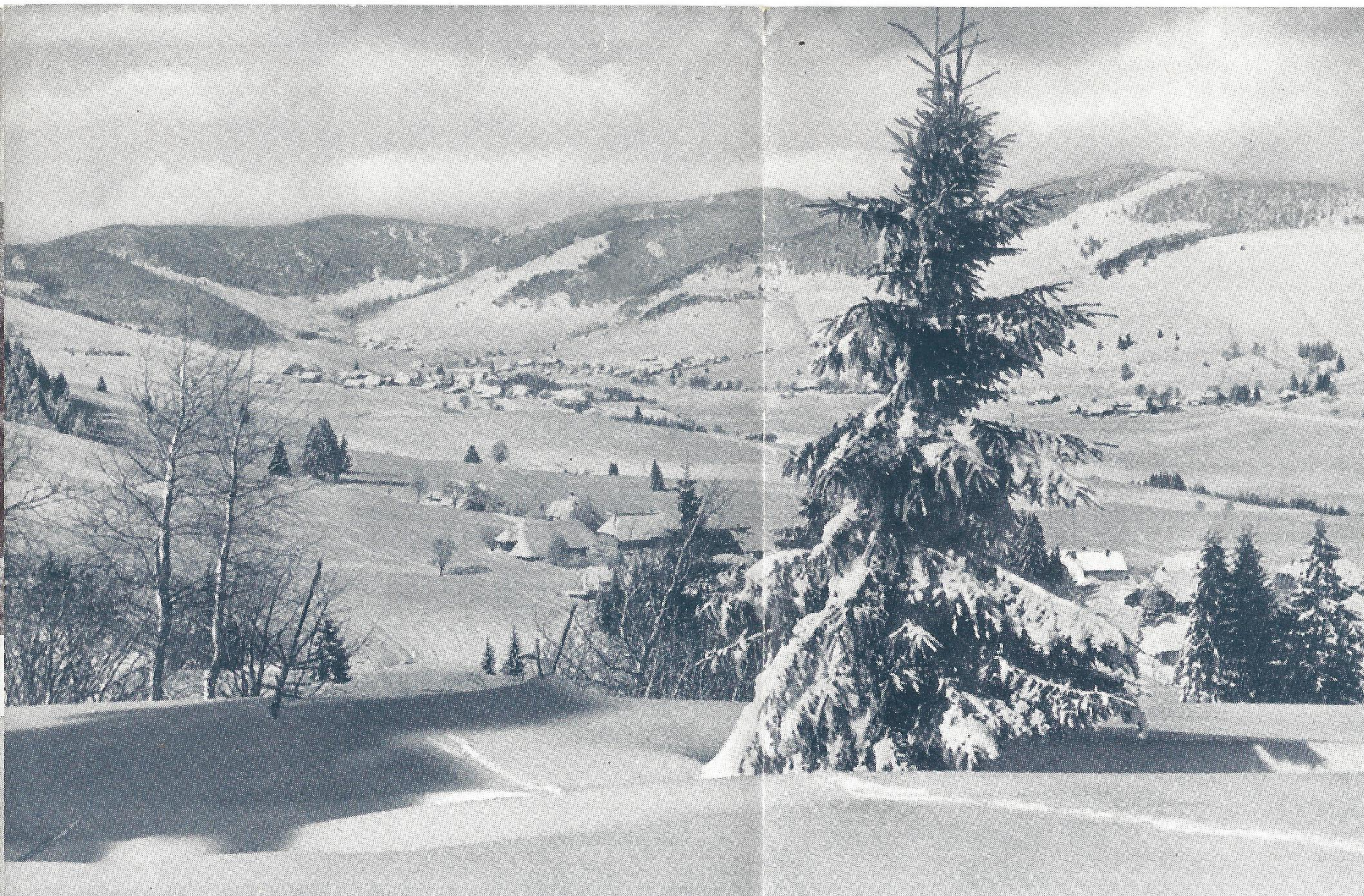
Bernau in Schnee und Sonne

Im Winter bietet Bernau geradezu ein ideales Gelände für den Wintersport, wie es wohl schöner und abwechslungsreicher nicht gedacht werden kann. Seine weitausgedehnten, schneereichen und baumlosen Bergabhänge lassen sowohl den Anfänger als auch den geübtesten Meister des Skisportes auf seine volle Rechnung kommen. Großartige Schlittenpartien durch die prachtvoll verschneite Schwarzwaldlandschaft. Skisport-Veranstaltungen.