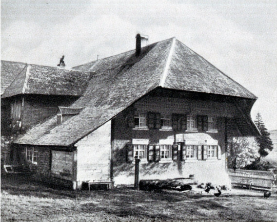
Hans-Thoma-Geburtshaus in Bernau-Oberlehen

Bernau , ein gern besuchter, weithin bekannter Höhenluftkurort im südlichen Schwarzwald, ist ein stilles mit viel Sonne bedachtes Hochtal im Feldberggebiet, das weit nach Süden geöffnet einen einzigartigen alpinen Charakter trägt. Idyllisch gelegen am Fuße des Herzogenhorns, vereinigt es alle Vorzüge in sich, die ein idealer Höhenluftkurort haben muß. Hier ist unerschöpfliche und abwechslungsreiche Schönheit von unverfälschter Natur. Echte Schwarzwälder Gastfreundlichkeit, reine Höhenluft, kräftige intensive Sonnenbestrahlung und freies Naturgenießen machen unser liebliches Hochtal zu einer begehrten Stätte der Ruhe und Erholung. Bernau ist weithin bekannt als die Geburtsstätte Hans Thoma's, des großen deutschen Meisters der Malkunst. Wenn im Frühjahr das mächtige Schwarz der Tannenwälder durch das saftige Grün der blühenden Matten und Berge zurückgedrängt wird, wenn die Waldvögel mit ihren herrlichen Weisen und der Auerhahn mit seinem Liebeslied das Erwachen der Natur ankündet, wenn im Sommer das Glockengeläute der Herden zu Tale dringt,