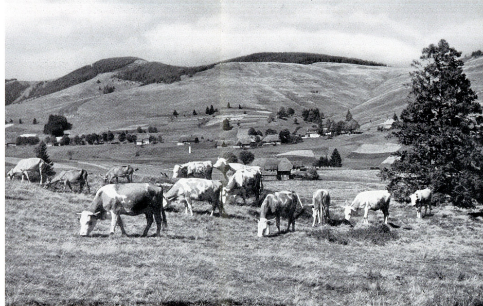
Bernau mit Vieherde