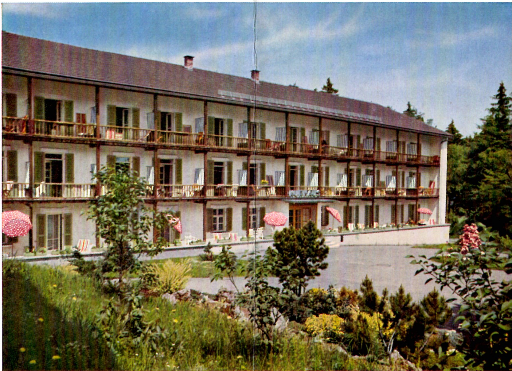
Die sonnigen Balkone und Terrassen des Kurhauses Bad Kohlgrub sowie die Liegewiesen bieten den Kurgästen in klarer Höhenluft Gesundheit und Erholung sowie eine herrliche Aussicht auf das Hörnle-Gebiet (1560 Meter hoch).