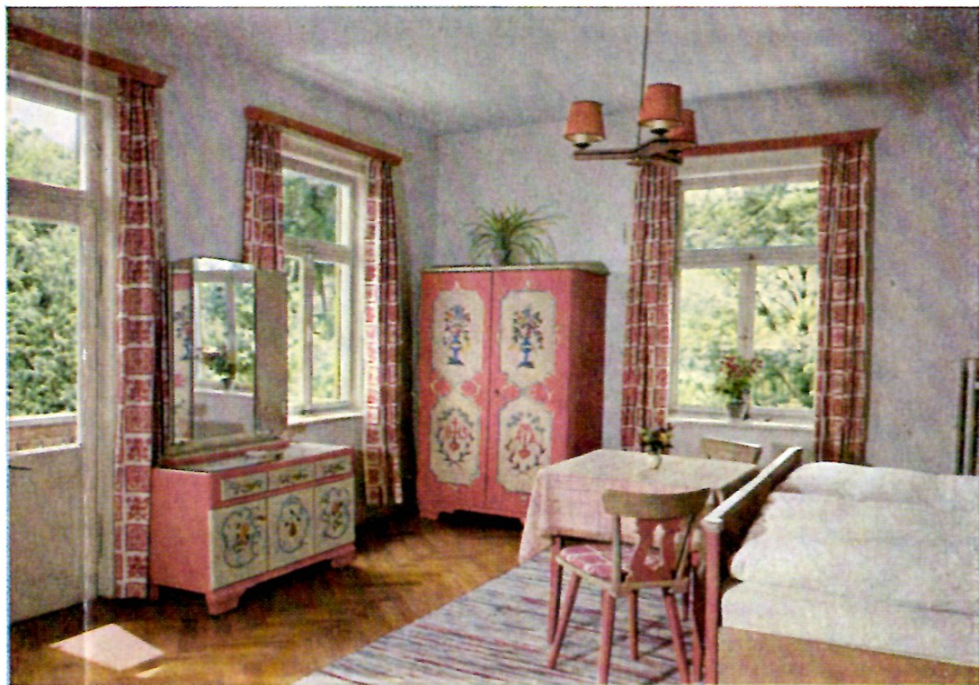
Zimmer im „Gästehaus Schönblick“

gibt. - Café und eigene Konditorei sorgen für das Wohl der Gäste.