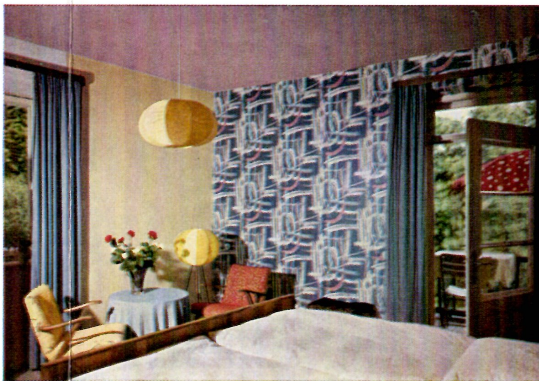
Modernes Gästezimmer im Kurhaus