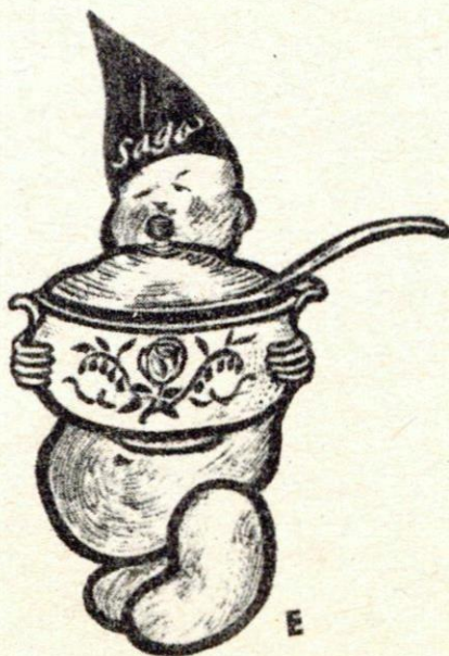
Sago ist der beste Suppenkoch

Die vorbereiteten Tomaten kocht man mit der angegebenen Flüssigkeitsmenge auf und streicht durch ein Sieb. Man läßt die Brühe noch einmal aufkochen, läßt den Sago einlaufen, garkochen und schmeckt zum Schluß mit Salz ab und gibt das Fett zu.