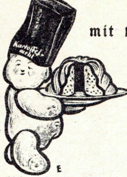
Kartoffelmehl, der beste Kuchenbäcker