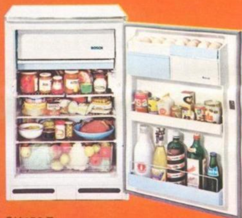
GK 150 T