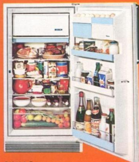
GK 180 S