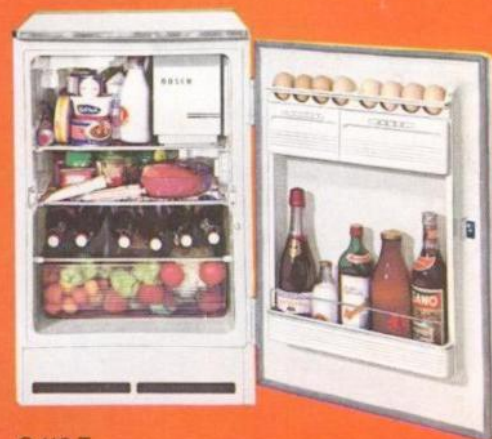
G 118 T