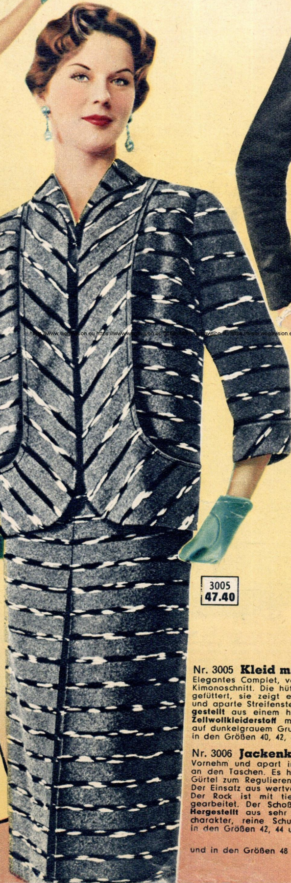
Abbildung des Kleides zu dem nebenstehenden Complet Nr. 3005