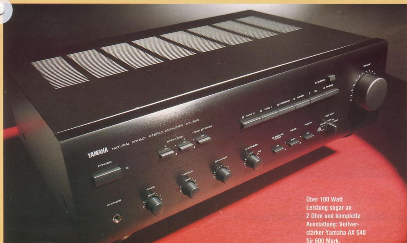
Über 100 Watt Leistung sogar an 2 Ohm und komplette Ausstattung: Vollverstärker Yamaha AX 540 für 600 Mark.