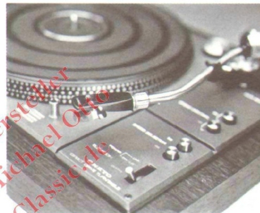
Schwerer Plattenteller mit Stroboskopteilung