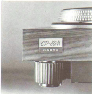
Isolierende justierbare FüÙe