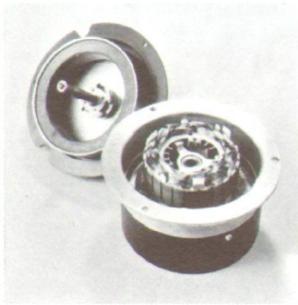
Direktgetriebener 8-Pol-24-Nuten-Motor mit Servoregelung