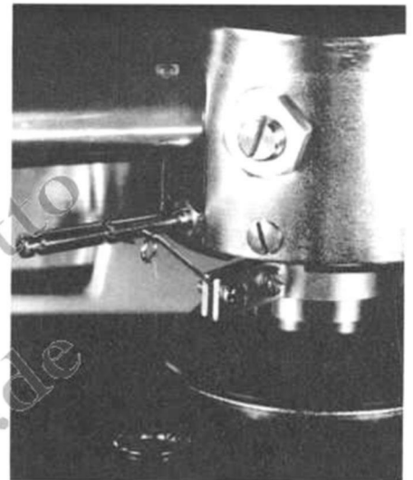
5 Die Anti-Skating-Vorrichtung des TP-12. Das unter das Tonarmbrett herabhängende Gewichtchen ist zweiteilig. Zusammen mit den drei Möglichkeiten der Aufhängung des Nylonfadens in den drei Kerben des Hebelarms, ergeben sich sechs verschiedene Anti-Skating-Einstellungen.