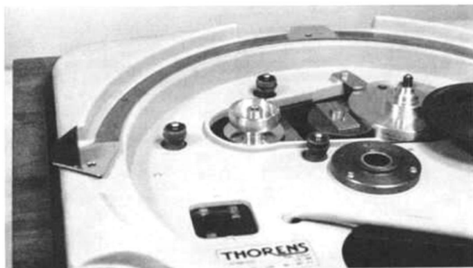
1 Die einzige Veränderung am Laufwerk des Thorens TD 124 II gegenüber seinem Vorgänger: die Drei-Punkt-Aufhängung des Antriebsmotors ist durch kräftigere Gummimuffen stärker bedämpft

Aus der Verbesserung des Rumpel-Fremdspannungsabstandes um 5 dB und des Gleichlaufs um 0,01 % ist man versucht, den Schluß zu ziehen, daß auch ein Plattenspieler erst ein bißchen eingefahren werden muß, bis er seine besten Eigenschaften entfaltet. Zum Vergleich seien nochmals die von DIN 45 500 als Mindestanforderung an HiFi-Geräte geforderten Werte genannt: Gleichlaufschwankungen \leq \pm 2\% ; Rumpel-Fremdspannungsabstand \geq 35 dB; Rumpel-Geräuschspannungsabstand \geq 55 dB.