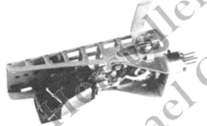
4 Der Tonarmkopf des TP-12 ist eine Leicht-Konstruktion. Die zwei seitlich angebrachten Nuten dienen zur Einstellung des Überhangs. Außerdem ist der das System tragende Teil des Tonarmkopfes, um die im Bild sichtbare Schraube als horizontale Achse drehbar, so daß eine Korrektur des vertikalen Spurfeldwinkels möglich ist.

Mit Hilfe der CBS-Meßplatte STR 111 (300-Hz-Modulationen der Amplituden 21,4, 36,7, 44,6, 63, 89 \mu horizontal und 21,4, 36,7, 44,6 \mu vertikal) wurde das Abtast-Verhalten des Tonarmes mit dem Stanton 581 EL geprüft, für das am Micro-Tonarm MA-88 Vergleichswerte vorliegen (Heft 3/66, S. 211). Die Ergebnisse sind aus Tabelle 2 zu entnehmen. Auch der Abtasttest qualifiziert den Tonarm als der guten Mittelklasse zugehörig. Zwar kann man nicht behaupten, daß er mit 205,— DM überzahlt sei, jedoch wäre es geschmeichelt, wollte man ihm den Qualitätsstandard des Plattenspielers TD 124 zusprechen. Br.