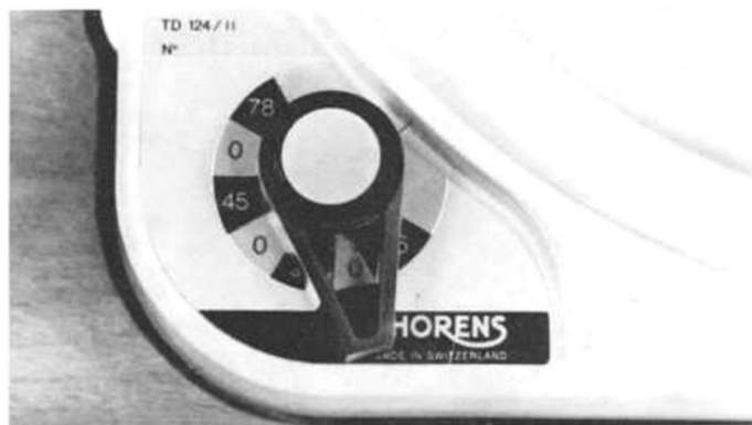
2 Bedienungsknopf und Bedienungsfeld des Thorens TD 124 II haben ein etwas moderneres Gesicht erhalten