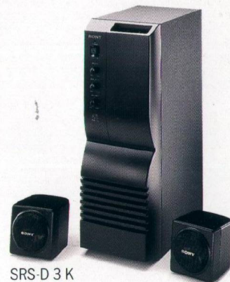
SRS-D 3 K