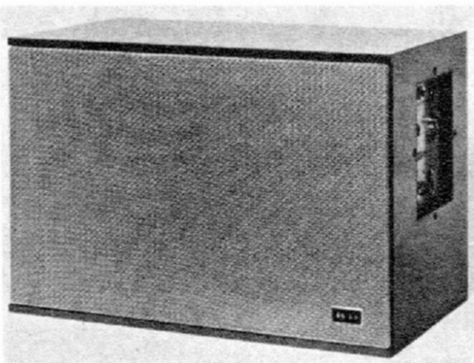
Bild 1. Der Studio-Regie-Lautsprecher OY in Frontansicht

Die genannten Schwierigkeiten lassen sich weitgehend vermeiden, wenn man die Lautsprecher nicht aus einem gemeinsamen Verstärker über LC-Weichen, sondern mit mehreren Verstärkern betreibt, also zu einem Mehrkanalsystem übergeht. Das Wiedergabe-Spektrum wird hierbei nicht lautsprecherseitig, sondern vor den Endverstärkern mit elektronischen Weichen aufgeteilt. Neben der günstigeren Energie-Bilanz bekommt man bei dieser Anordnung ein besseres Einschwingverhalten mitgeschenkt, nämlich durch den Fortfall üblicher LC-Weichen. Mit dem nach diesen Grundsätzen aufgebauten K + H-Regie-Lautsprecher OY