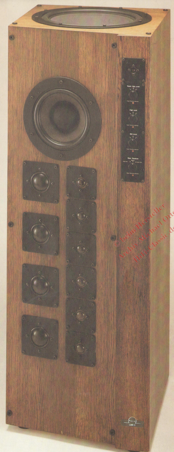
Heco LAB 3 rechts