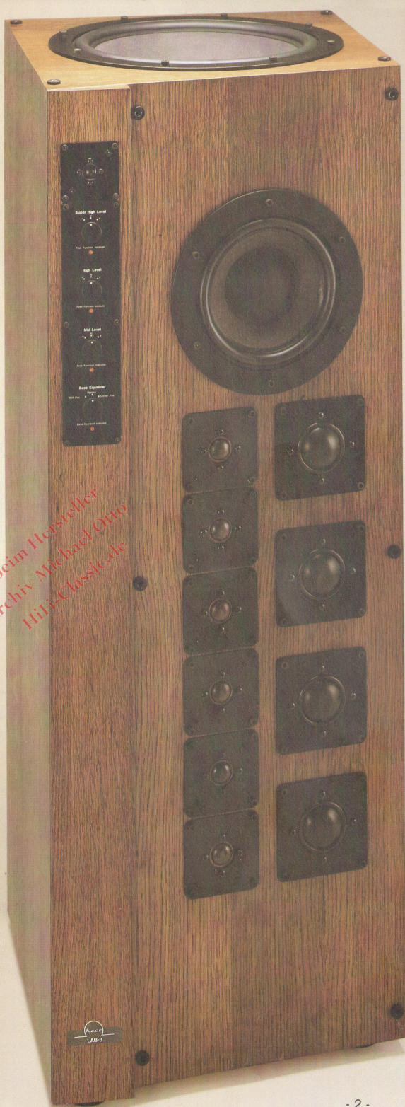
Heco LAB 3 links