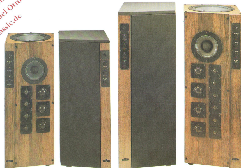
LAB 2 links