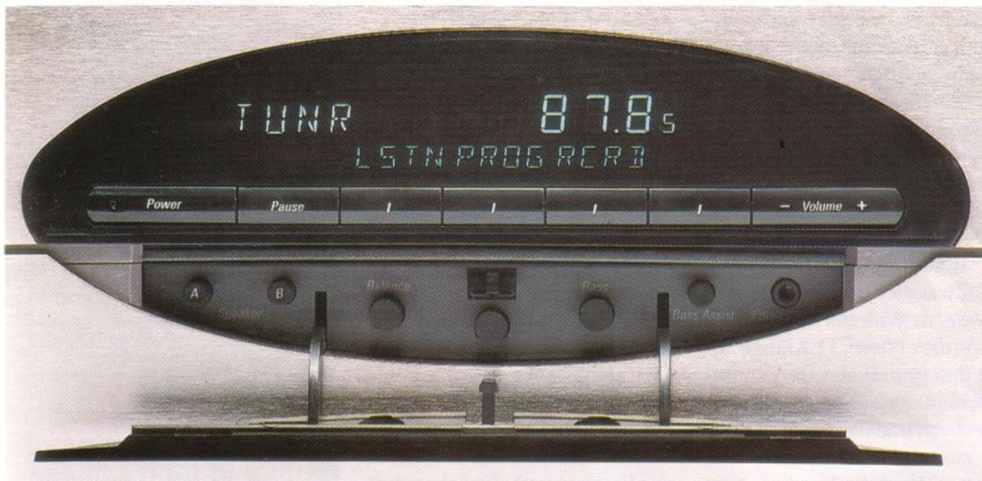
Zweigeteilt: Während die Hauptbedientasten und das Display zur Tuner-Vorstufe gehören, befinden sich die seltener benötigten Regler und die Kopfhörerbuchse im Endstufengehäuse. Eine filigrane Klappe verdeckt die etwas mühsam erreichbaren Knöpfe.

leben. Das Gros der kleinen Anlagen muß mit deutlich schwächeren Verstärkern auskommen. Bei der Wahl des Lautsprechers ist man bei der Festival 500 also nicht allzusehr eingeschränkt.