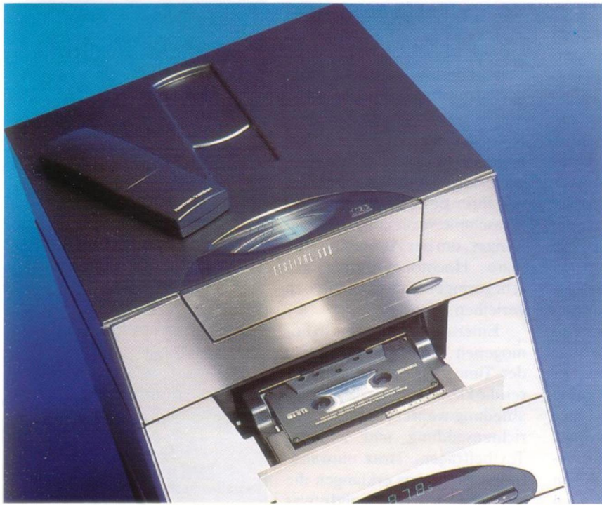
Formvollendet: Das sonnige Plätzchen hoch oben auf dem CD-Player ist für die Fernbedienung reserviert. Der eleganten Designlinie folgen auch die identisch gestylten Läden von Player und Recorder.