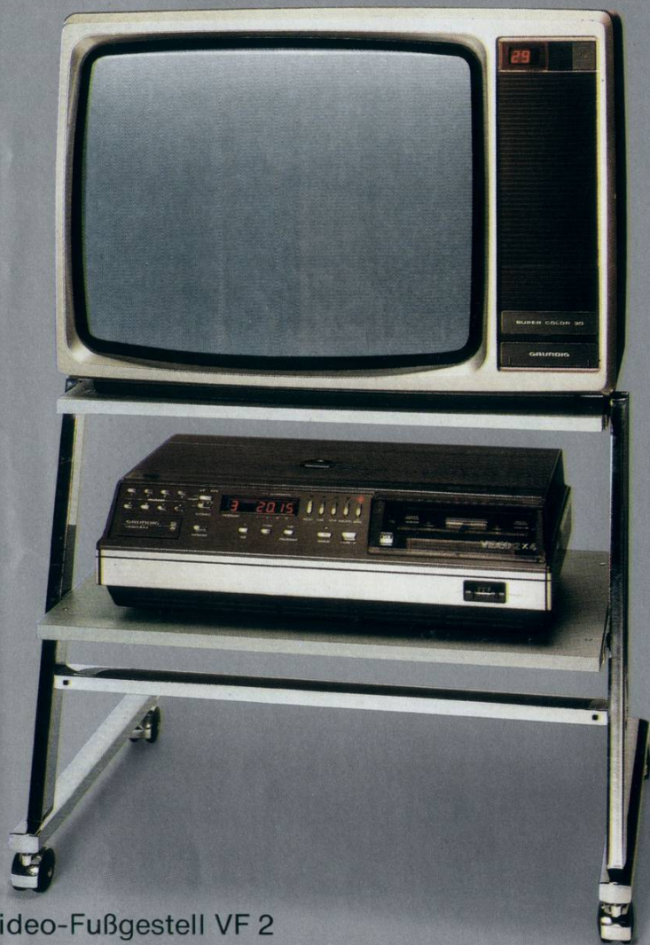
Video-Fußgestell VF 2