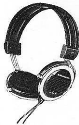
GRUNDIG HiFi-Hörer 217

Die Anschlußbuchse für einen Stereo-Kopfhörer sitzt in der Frontseite des Gerätes (Pos. 2). Es eignen sich Kopfhörer mit 6,3-mm-Klinkenstecker und Impedanzen von 8 bis 2000 \Omega . Optimal angepaßt sind GRUNDIG Stereo-Kopfhörer.