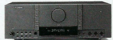
Receptor Midi R 210 com 2 x 100/50 Watts de potência musical/sinusoidal e 59 posições de memória