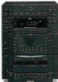
Sistema Mini M 10 2 x 35/22 Watts de potência musical /sinusoidal