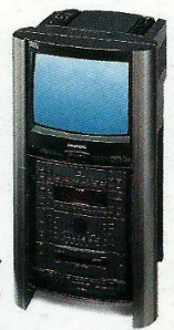
Steelers/TV e Audio