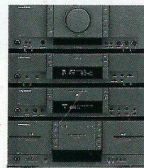
Sistema Midi V 210, T 210, CD 210, CCF 210 2 x 100/50 Watts de potência musical /sinusoidal