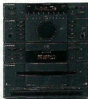
Sistema Mini M 5 2 x 16/12 Watts de potência musical /sinusoidal