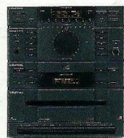
Sistema Mini M 1 Sistema mini portátil