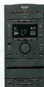
Sistema Mini Compacto MC 10 2 x 40/25 Watts de potência musical /sinusoidal