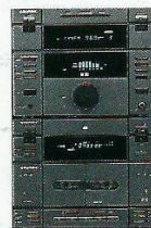
Sistema Mini M 20 2 x 50/36 Watts de potência musical /sinusoidal