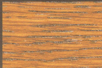
Eiche Rustikal Furnier