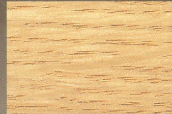
Eiche Roh Furnier