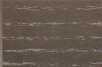
Esche Schwarz Furnier