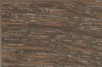
Eiche Maron Furnier