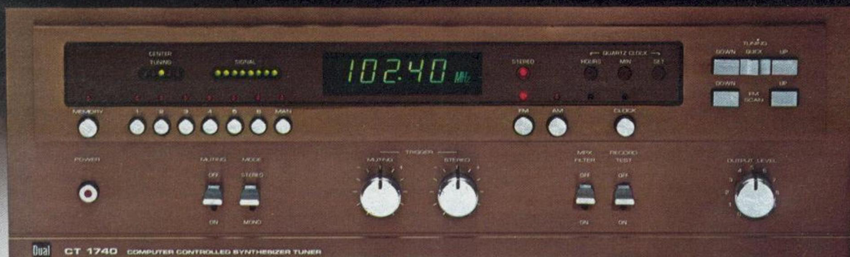
Dual CT 1740 COMPUTER CONTROLLED SYNTHESIZER TUNER

Dual CV 1700. HiFi-Verstärker. Diese Komponente profiliert sich nicht nur durch enorme Watt-Leistung. Auf Grund der Ausstattung der professionellen Regelemente ist es richtiger, statt vom Verstärker von einer Leistungszentrale zu sprechen. HiFi-Technik für Kenner, die ausschließlich das Beste zum Maßstab ihrer Ansprüche machen.