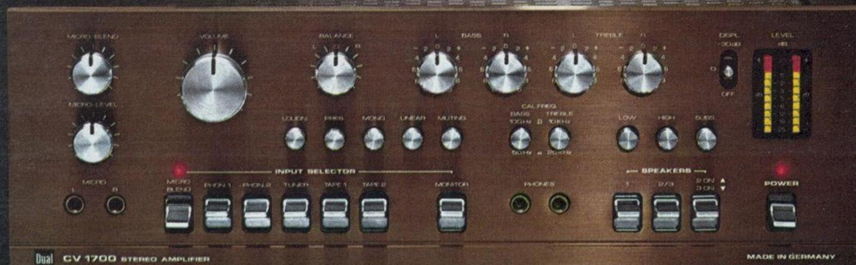
Dual CV 1700 STEREO AMPLIFIER