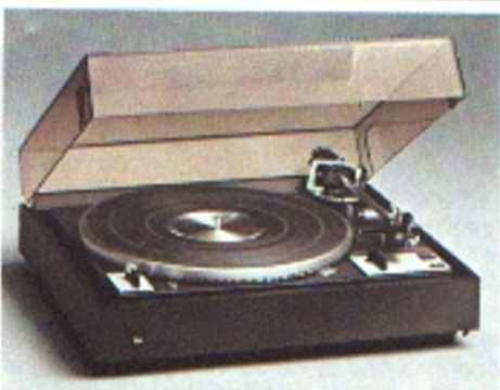
Dual CS 1249 - Belt Drive, HiFi-Automatikspieler mit Wechsel-einrichtung

Manueller und automatischer Plattenspieler mit Wechseleinrichtung, Einbauchassis. Kompakter HiFi-Automatikspieler der Spitzenklasse. Dual 4-Pol-Synchronmotor; 1,8 kg Druckfuß-Plattenteller; 33 1/3 und 45 U/min; Tonhöhenabstimmung; Leuchtstroboskop; gewichtsbalancierter Alu-Rohr-Tonarm; Magnet-Tonabnehmersystem Shure M 95, empfohlene Auflagekraft: 12,5 mN (1,25 p); Antiskating-Einrichtung; niederkapazitive Tonarmleitung für Quadrofonie; Spurwinkel-Selector; Start/Stop- und Wechsel-Automatik; Tonarmlift.