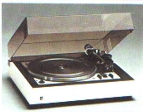
Dual CS 1228, HiFi-Automatikspieler mit Wechsel-einrichtung

Welcher Musikgenießer wollte auf einen extrem leichten Kopfhörer verzichten? Dual Kopfhörer gehören zur Generation halboffener, orthodynamischer HiFi-Kopfhörer. Samtweich liegen sie an den Ohren an, sind »frisurfrendlich« und geben Musik naturgetreu in allen Nuancen wieder.