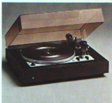
Dual CS 1225-1, HiFi-Automatikspieler mit Wechseleinrichtung

Manueller und automatischer Plattenspieler mit Wechseleinrichtung, Einbauchassis. Dual Einphasen-Asynchronmotor; Stahl-Sandwich-Plattenteller; 33 1/3 und 45 U/min; Tonarm-Aufsetzautomatik mit Drehzahlumschaltung gekoppelt; Tonhöhenabstimmung; gewichtsbalancierter Alu-Rohr-Tonarm; Stereo-Keramik-Tonabnehmersystem Dual CDS 660, empfohlene Auflagekraft: 45 mN (4,5 p); Antiskating-Einrichtung; Start/Stop- und Wechsel-Automatik; Tonarmlift.