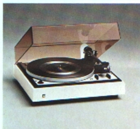
Dual CS 1224, Stereo-Automatikspieler mit Wechseleinrichtung

sind spielfertig; komplett mit Stereo-Plattenspieler, Stereo-Verstärker und zwei Breitband-Lautsprecherboxen. Die integrierten Stereo-Bausteine sind harmonisch aufeinander abgestimmt. Für zusätzliche Tonquellen – Tuner, Tonband- oder Cassettengerät – sind Anschlußbuchsen an der Geräterückseite. Nußbaumfarbene oder weiße Konsolen und getönte Abdeckhauben runden das funktionale Design ab.