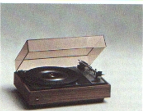
Dual CS 430, Stereo-Semi-Automatikspieler

Riemengetriebener, manueller und automatischer Plattenspieler mit Wechseleinrichtung, Einbauchassis. Dual 8-Pol-Synchronmotor, extrem laufruhig; Alu-Druckfuß-Plattenteller; 33 1/3 und 45 U/min; Drehzahlumschaltung mit Vorwahlautomatik; Tonhöhenabstimmung mit »Vario-Pulley«; Leuchtstroboskop; gewichtsbalancierter Alu-Rohr-Tonarm; Magnet-Tonabnehmersystem Shure DM 103 M-E oder Shure 101 M-G, empfohlene Auflagekraft: 10 mN (1 p); Antiskating-Einrichtung; niederkapazitive Tonarmleitung für Quadrofonie; Mode-Selector zur optimalen Einhaltung des vertikalen Spurwinkels; Dauerspiel wählbar.