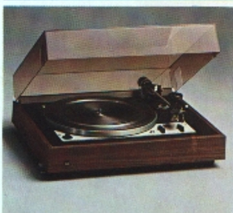
Dual CS 1226, HiFi-Automatikspieler mit Wechseleinrichtung

Manueller und automatischer Plattenspieler mit Wechseleinrichtung, Einbauchassis. Dual 4-Pol-Asynchronmotor; Stahl-Sandwich-Plattenteller; 33 1/3 und 45 U/min; Tonarm-Aufsetzautomatik mit Drehzahlumschaltung gekoppelt; Tonhöhenabstimmung; gewichtsbalancierter Alu-Rohr-Tonarm; Magnet-Tonabnehmersystem Dual DMS 210, empfohlene Auflagekraft 25 mN (2,5 p); Antiskating-Einrichtung; niederkapazitive Tonarmleitung für Quadrofonia; Start/Stop- und Wechsel-Automatik; Tonarmlift.