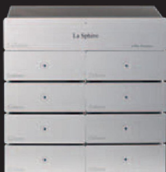
PROCESSEUR ET AMPLIFICATEURS NUMÉRIQUES LA SPHÈRE