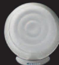
BALTIC Centrale Evolution