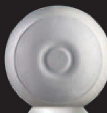
RIGA Centrale Evolution