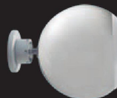
BALTIC Murale Evolution