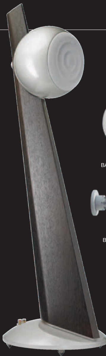
BALTIC sur pied