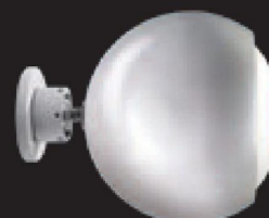
RIGA Murale Evolution