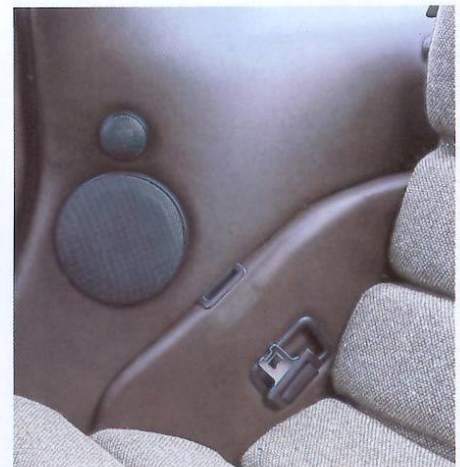
Seitenverkleidung Porsche 928.