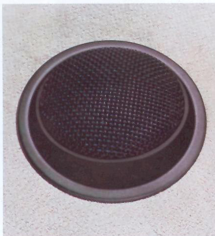
Frontbündige Montage des Hochtöners.