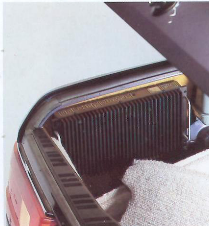
Kofferraumverkleidung BMW 7er-Reihe.