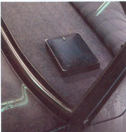
Heckablage BMW 7er-Reihe.