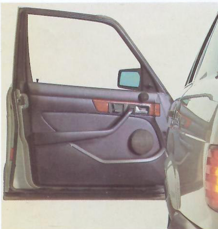
Türverkleidung Mercedes S-Klasse.