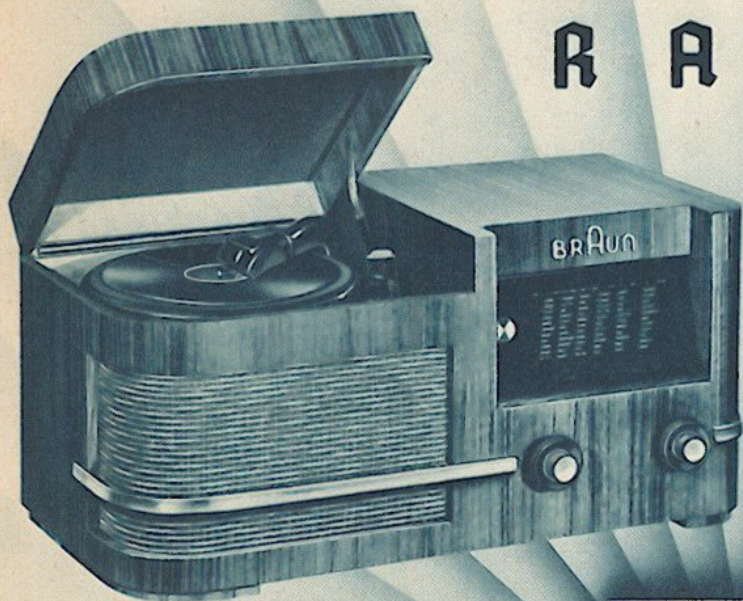
BRAUN-PHONO-SUPER 639 W/GW