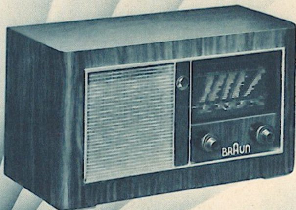
BRAUN-SUPER 639 W/GW