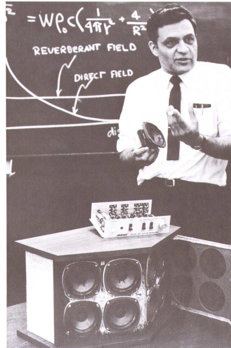
Prof. Dr. Amar G. Bose während seines Vortrages in Hamburg im Frühjahr 1971.

Der 501 ist völlig ausgewogen. Er ist in der Tat bei keiner Frequenz eine kugelförmige Schallquelle. Die Durchsichtigkeit ist außergewöhnlich gut. Der Baß trocken und ohne Resonanzüberhöhung. Der Baßbereich reicht bis zu dem noch praktisch brauchbaren Grundton von ca. 30 Hz. Für diesen Preis ist dies einer der besten Lautsprecher, die auf dem Markt vertreten sind. Seine extreme Klarheit, verbunden mit seiner außergewöhnlichen Verzerrungsarmut der hohen Frequenzen, bringt einen „elektrostatischen“ Klang. Zwar ist der 501 nicht so gut wie der 901 – welcher Lautsprecher ist das schon – aber der 501 ist ein ausgezeichnetes Produkt, das einen großen Kreis verschiedener Geschmäcker ansprechen wird bei einem wahrhaft fairen Preis.