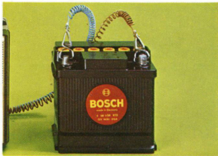
Betrieb an 12-Volt-Batterie.