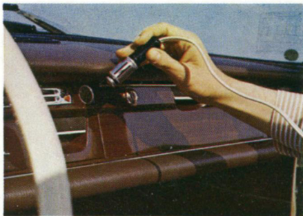
Auto-Batterie-Anschluß durch Adapter für Zigarettenanzünder.

Blaupunkt Bahia — die neue Formel für modernes, vielseitiges und ortsungebundenes Fernsehen. Fernsehen zum Mitnehmen. Weil Sie den Bahia am Netz und an der Autobatterie betreiben können. Und weil der Bahia