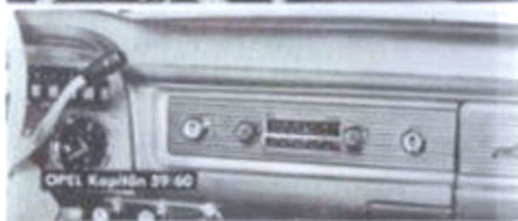
OPEL Kapitän 59-60