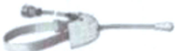
V F 1097a (schwarz) DM 24,—

Fernbedienungsgeräte mit Kabel und Stecker für verstellbare Lenkstütze über 71 mm Ø