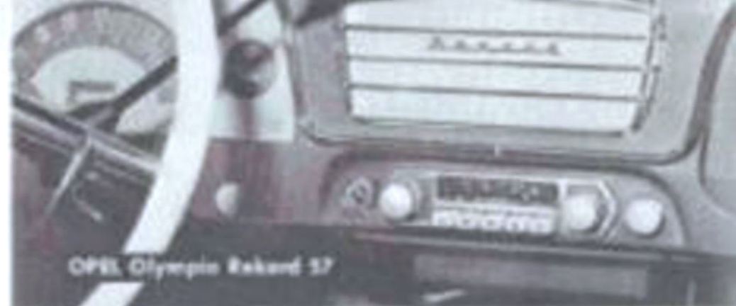
OPEL Olympia Rekord 57

Einstecktyp-Fernbedienungsgeräte mit Kabel und Stecker per Montage in Armaturenbrett oder Fond