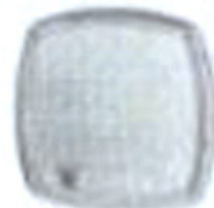
A LA 7700a 100 x 120 mm DM 21,30

Jeder BLAUPUNKT-Autoradio-Zubehörsatz wird mit einem Qualitätslautsprecher geliefert, der für leistungsfähige und klare Klangwiedergabe der Sendung sorgt. Für die im Wagenfundamenten empfohlene Ausstattung ist die Abfertigung eines Zweitlautsprechers, für den es jedem BLAUPUNKT-Autoradio-Anschlußfeldchen vorhanden sind.