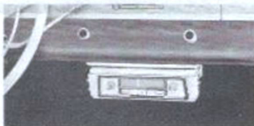
Derby „H“ als Autoradio im Wagen

Aus der Kassetze herausgezogen, ist das Gerät WESTERLAND ein komplettes, tragbares Volltransistor-Gerät, mit eingebauter Antenne und Kleinbatterie betrieben, unabhängig vom Wagen überall spielbereit