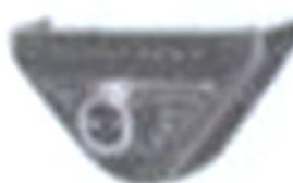
G WS 22162a Überblendregler in Gehäuse mit Koffel und Stecker DM 34,—

Mit einem Überblendregler kann das Verhältnis der Lautstärke beider Lautsprecher zueinander beliebig geregelt werden, so daß die Schallverteilung im Wageninnern nach Wunsch geregelt werden kann.