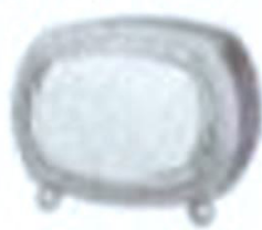
C LA 7707a 200 x 140 mm mit Tragegriff, runderisoliert 1 pro Kabell DM 29,—