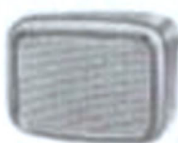
M LA 8227a 196 x 176 mm DM 46,—