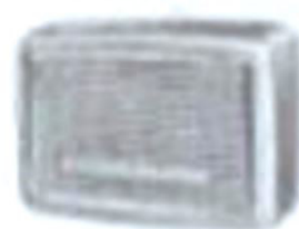
I LA 8407a 176 x 120 mm DM 29,—