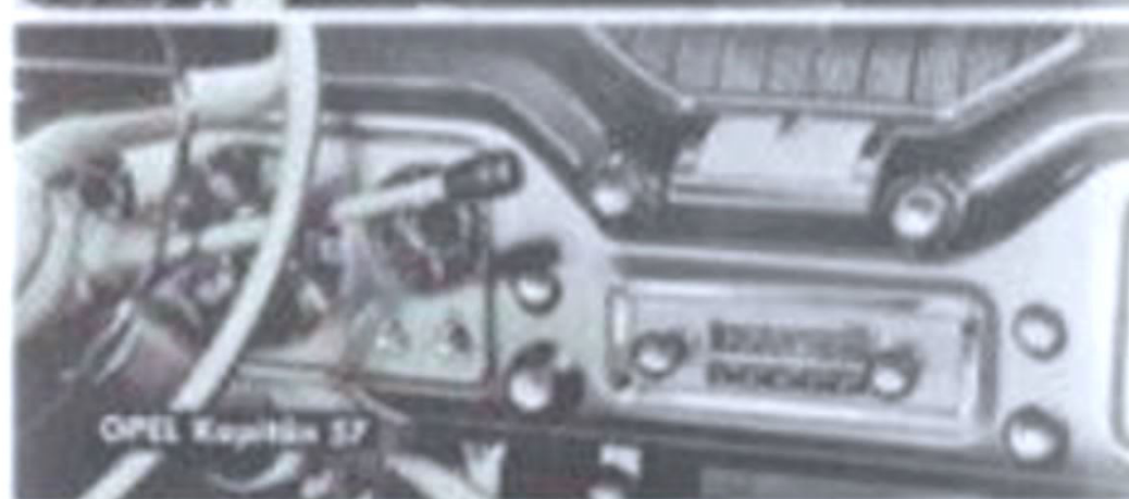
OPEL Kapitän 57