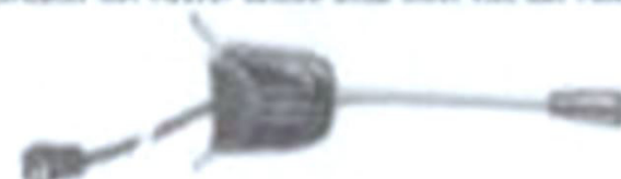
Y F 1097a DM 24,— (schwarz)

Mit Hilfe einer Fernbedienung kann der Antennen EIN/AUS der Tuner von der Lenkstäbe oder von einer anderen Stelle fernbedient werden. Dadurch braucht der Fahrer seinen Blick nicht von der Fahrbahn abzuwenden.