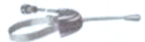
W F 1097a (schwarz) DM 24,—

Fernbedienungsgeräte mit Kabel und Stecker für Lenkstütze bis 71 mm Ø