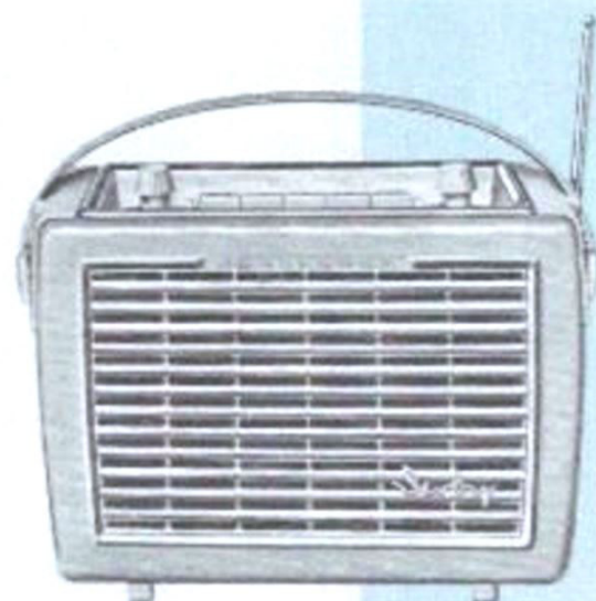
Derby „H“ Alltransistor-Combi-Kofferradio für Auto und Reise