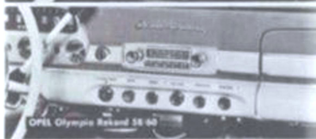
OPEL Olympia Rekord 58-60