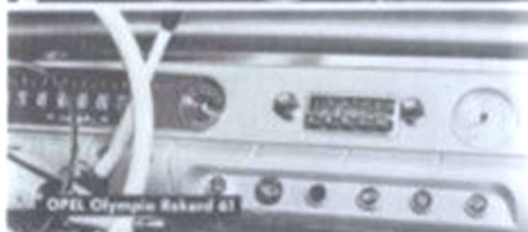
OPEL Olympia Rekord 61