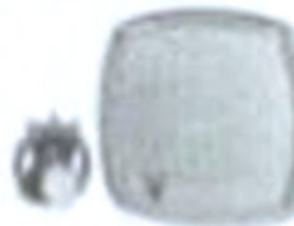
L LA 8417a 126 x 120 mm DM 45,—