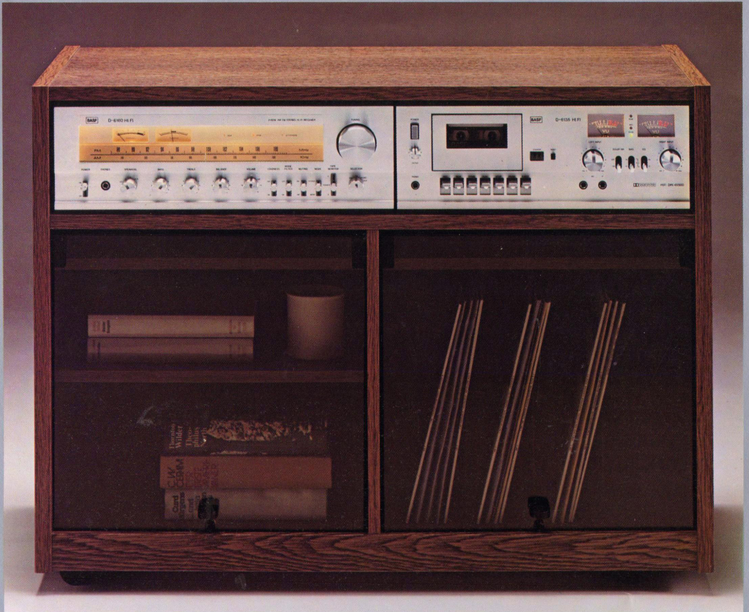
BASF D 6160 HiFi-Receiver BASF D 6135 HiFi-Stereo-Deck (Frontloader) BASF HiFi-Stereoboard S 61