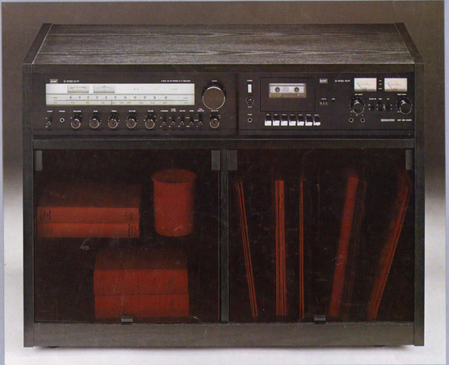
BASF D 6160 HiFi-Receiver BASF D 6135 HiFi-Stereo-Deck (Frontloader) BASF HiFi-Stereoboard S 61