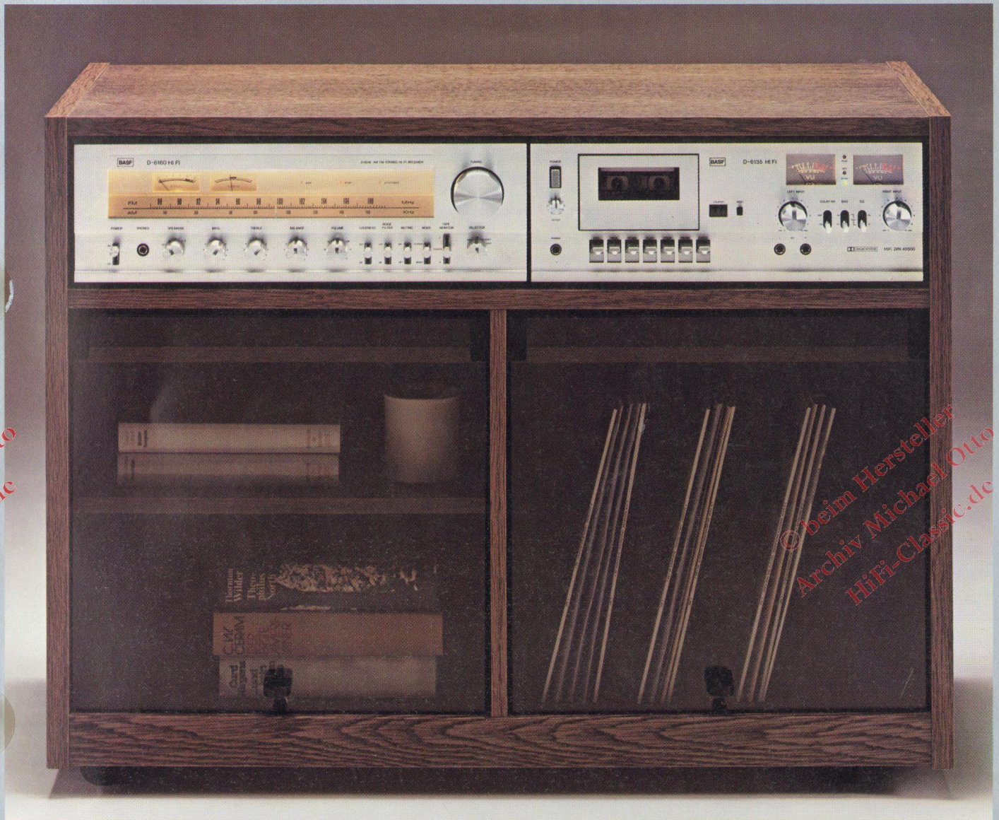
BASF D 6160 HiFi-Receiver BASF D 6135 HiFi-Stereo-Deck (Frontloader) BASF HiFi-Stereoboard S 61