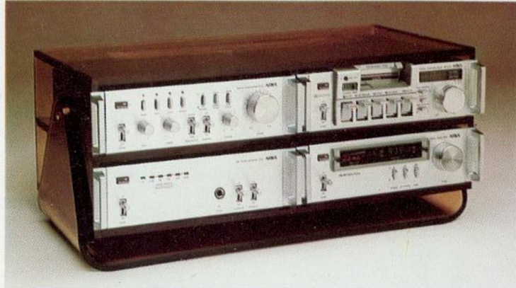
Acrylglas, rauchfarbig für 4 Komponenten. 48,5 cm breit, 21 cm hoch. Der Standbügel kann um 90° nach hinten geschwenkt werden. Eine ideale Wandbefestigung mit einer Tiefe von nur 25 cm.