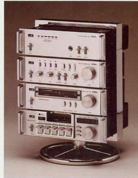
Verchromter Stahlrahmen, drehbar auf rundem Fuß. 23,5 cm breit, 34 cm hoch. Für 4 Komponenten übereinander. Kann durch auswechselbares Seitenteil (Steckadapter) für 3 Geräte variiert werden.

Für „sie“ – um die Stunden ohne „ihn“ schöner zu machen; für „ihn“ – um den Büro-Alltag zum Klingen zu bringen; für „es“ – um mit HiFi schon hochwertig zu beginnen; für „alle“ – um Wochenende und Urlaub HiFi zu genießen.