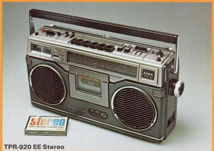
TPR-920 EE Stereo