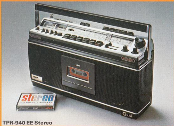
TPR-940 EE Stereo