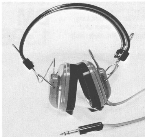
AERA-Kopfhörer Eine Spezialentwicklung, die vollkommenen Raumklang vermittelt. Man hört perfekt und ungestört, ohne andere zu stören. DM 39,-