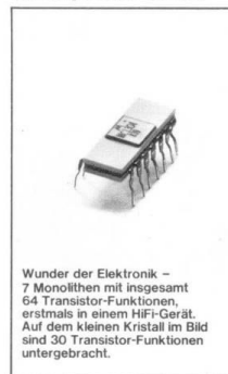
Wunder der Elektronik – 7 Monolithen mit insgesamt 64 Transistor-Funktionen, erstmals in einem HiFi-Gerät. Auf dem kleinen Kristall im Bild sind 30 Transistor-Funktionen untergebracht.

Die integrierte Schaltung mehrerer Transistorfunktionen auf einem Kristall. Anders gesagt: ein mehrstufiger Linearverstärker mit vielen Transistorfunktionen. Die Verwendung von Monolithen in HiFi-Steuergeräten ist neu.