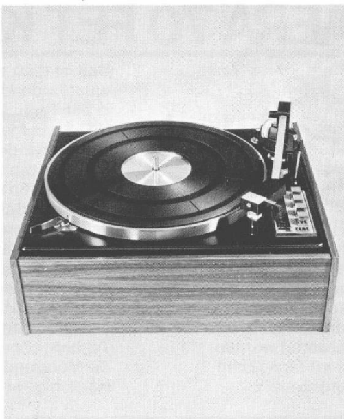
ELAC 50 H, ein hervorragender HiFi-10-Plattenswechsler mit international ausgezeichnetem Abtastsystem STS 344. DM 398,-

Wenn Sie noch keinen geeigneten HiFi-Plattenspieler besitzen, empfiehlt Ihnen Ihr AERA-Händler zur Schonung Ihrer wertvollen Schallplatten den neuen Plattenspieler ELAC 50 H.