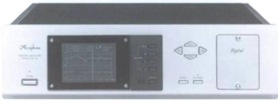
Einbau in Holzkabinett W-1 möglich