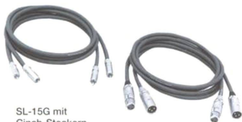
SL-15G mit Cinch-Steckern