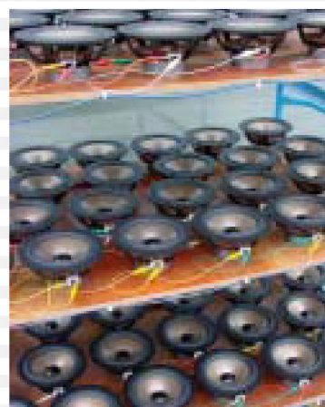
BURN IN TEST

To find approval from the audio reviewers is an achievement in itself, but when our customers nominated us as product winners in consumer choice categories our convictions were further justified. ALR JORDAN loudspeakers are now available in most countries in the world and the reaction from retailers, consumers and the press has been the same. Whatever your choice, all the Entry Series models reproduce with finesse. It is a product of excellence in both quality and value for money.