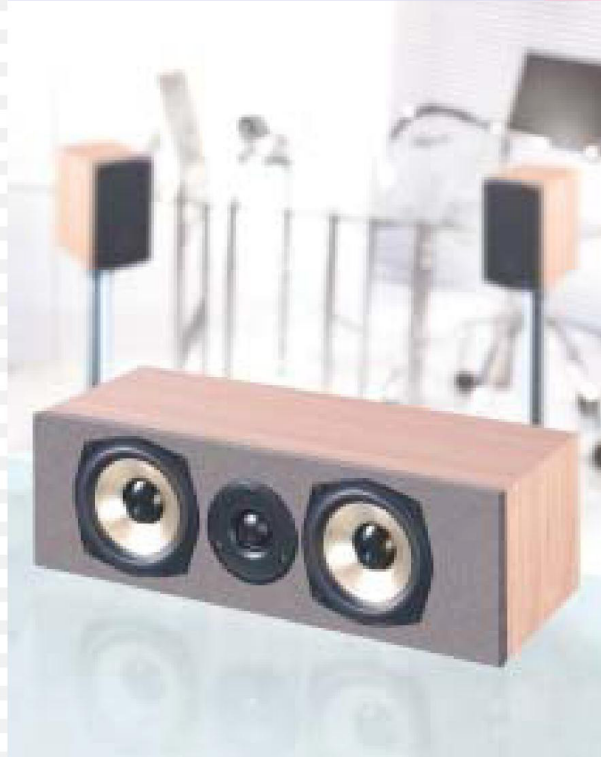
2-Wege Bass Reflex System