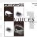
CD - 1