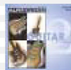
CD - 2