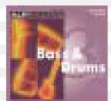
CD - 3

ALR JORDAN customers have always had the confidence of a superior product. The drive units are manufactured specifically for each individual loudspeaker and the crossover components are of the finest audiophile quality. This ensures maximum performance and high reliability.