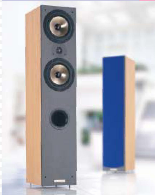
2-Wege Bass Reflex System