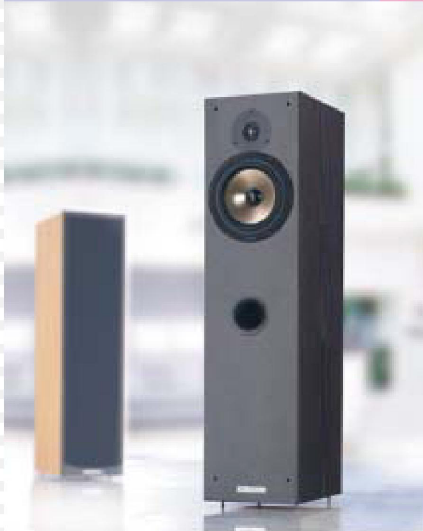
2-Wege Bass Reflex System