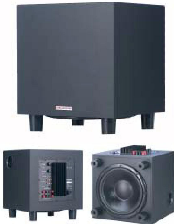
Aktives Basslautsprecher System