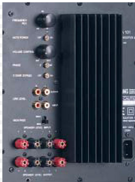
SUB - MODULE

The philosophy of our company is simple: it is to produce the finest products; material selection; production processes; attention to detail and inspection all reflect this. Technology and tradition are in balance; decisions are made to optimise the performance not the words in the brochure. All loudspeakers are handmade in Germany.