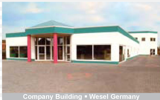
Company Building ▪ Wesel Germany

Lassen Sie uns vorweg ein paar Informationen über unser Unternehmen preisgeben: Nach ihrer Gründung im Jahre 1989 in Essen widmete sich die Firma ALR der Entwicklung hochwertiger Lautsprecherboxen, die zunächst nur auf dem deutschen Markt vertrieben wurden. Die hervorragenden klanglichen Eigenschaften unserer Lautsprecher wurden alsbald von einer Vielzahl zufriedener Kunden und Fachhändler bestätigt. Einzel- und Vergleichstests in der Fachpresse, aus denen unsere Produkte häufig als Testsieger hervorgingen, festigten die herausragende Stellung der ALR-Lautsprecher im Kreis der übrigen Testkandidaten und verschafften ihnen internationale Anerkennung. Auch die Leser der Fachpresse wählten unsere Produkte zu ihren Lieblingen.