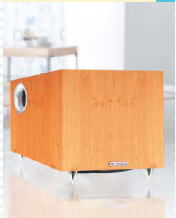
Aktives Basslautsprecher System