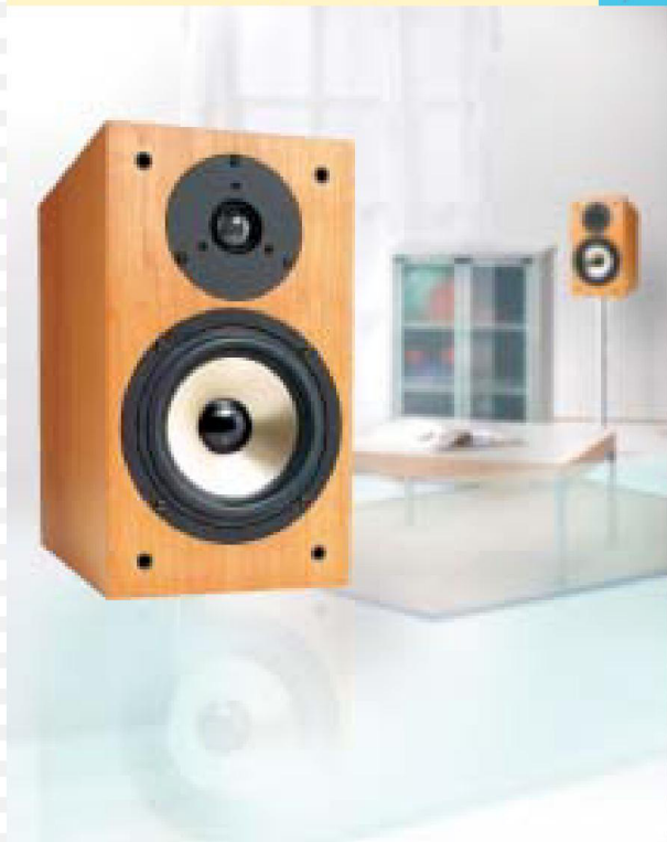
2- Wege Bass Reflex System