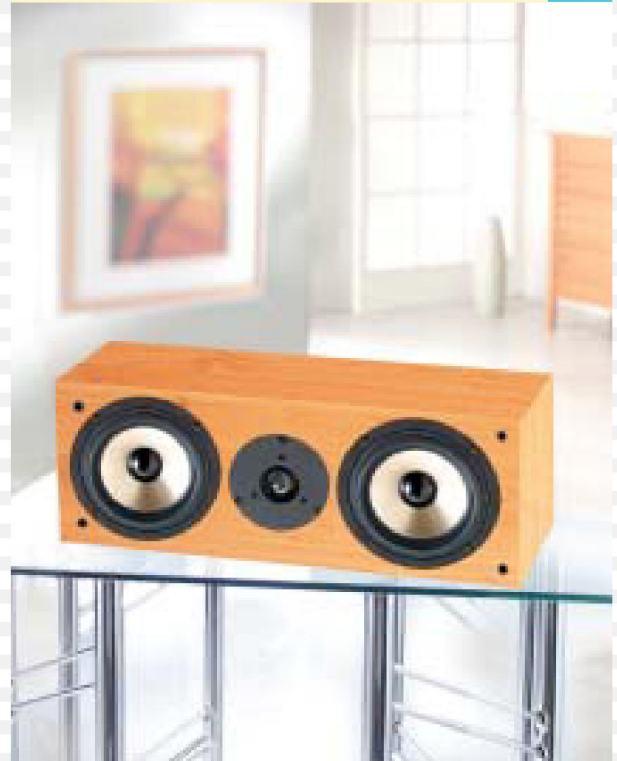
2- Wege Bass Reflex System