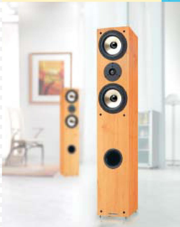
2- Wege Bass Reflex System