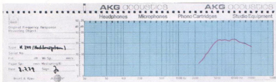
Frequenzkurve Hochtonsystem (elektrostatisch)

Damit können Sie stundenlang Musik hören – viele LPs lang.