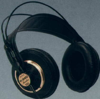
Seite 10 K 240 Monitor — Der Klassiker