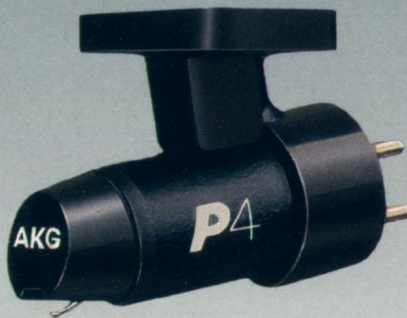
Seite 14 P 4, P 4DP, P 5 — Die Preiswerten