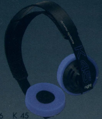
Seite 6 K 45 — Der Robuste