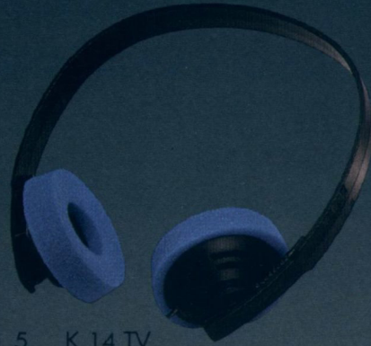
Seite 5 K 14 TV — Der Fernsehhörer