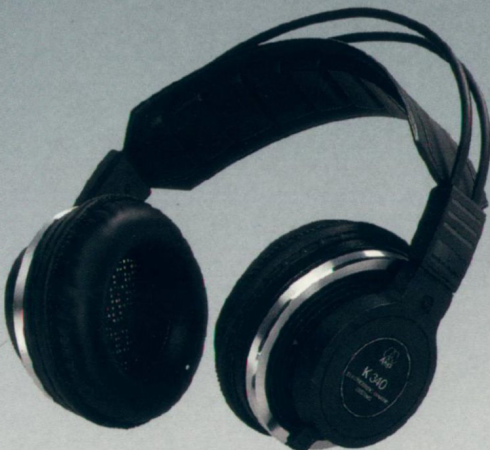
Seite 13 K 340 — Der Gediegene