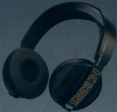
Seite 7 K 135 — Der Kraftvolle