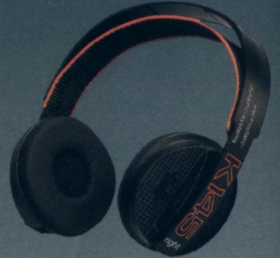
Seite 9 K 145 — Der Innovative