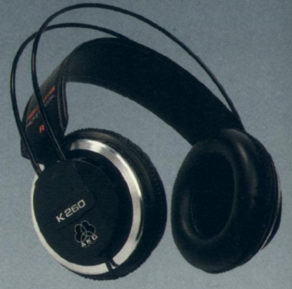
Seite 12 K 260 Professional — Der Fortschrittliche