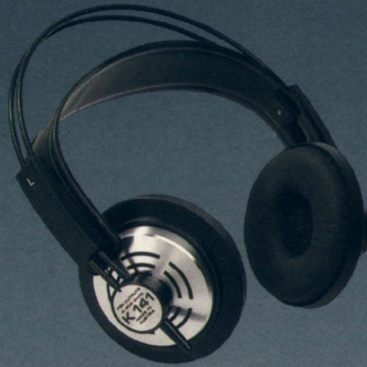
Seite 8 K 141 — Der Universelle