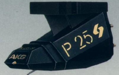
Seite 15 P 10 S, P 10 ED Studio, P 15 S, P 25 S, — Die Spezialisten