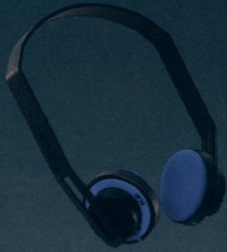
Seite 4 K 2 — Der Mobile