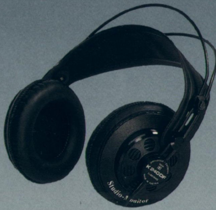
Seite 11 K 240 DF — Der Professionelle