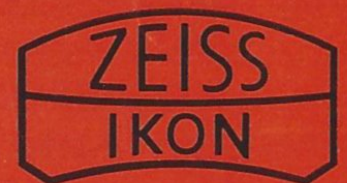
Photo · Kino · Projektion München 22 · Maximilianstraße 32 Telefon 22 60 45