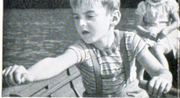
f = 9 mm