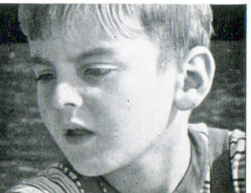
f = 30 mm

Diese Bilder sind ein Beispiel dafür, was Sie mit dem Vario-Objektiv alles machen können. Ohne einen Schritt zu tun, filmen Sie alle fünf Szenen vom gleichen Standpunkt aus. Ein Griff, und schon wird Ihr Motiv größer oder kleiner aufgenommen. Oder noch besser: Sie verändern die Brennweite während der Aufnahme. Im Film sieht das so aus, als ob Ihre Kamera zu den Kindern hinfährt, in Wirklichkeit bleiben Sie ruhig stehen und erleben den „Fahreffekt“ schon im Sucher der Kamera. Der Einstellhebel für das Objektiv sitzt an der Kamera nahe dem Schwerpunkt; deshalb werden die „Fahraufnahmen“ auch so ruhig.