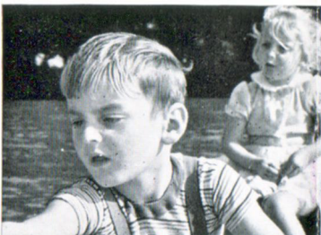
f = 20 mm