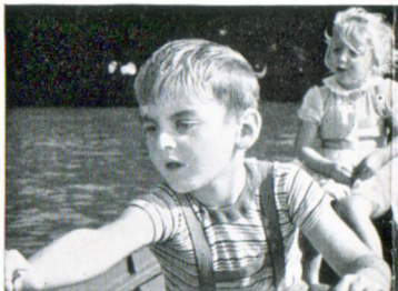
f = 15 mm