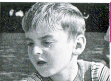
f = 25 mm