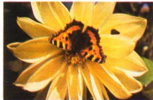
Makro-Linse vorschieben – „makro“ einstellen, ganz nah rangehen, bis auf 25 cm – auslösen.

Agfamatik 5008 makro pocket Agfamatik 6008 makro pocket Die pocket-Genies mit Makro-Linse. Für jeden Entfernungsbereich und für jedes Licht. Das ist neu. Eine pocket mit integrierter Makro-Linse. Jetzt können Sie endlich auch ganz nah heran ans Motiv – bis 25 cm. Um Blumen, Briefmarken, Schmuck und andere Details in voller Größe und in voller Schärfe aufzunehmen. Und außerdem: Die vollautomatische Belichtung. Die Elektronik stellt Zeit und Blende präzise ein – von greller Sonne