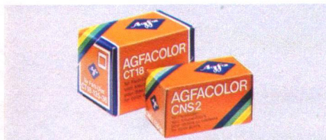
Agfacolor CT 18 – farbtreu bis in die feinsten Töne.

Schnellrückspulung, extrem großer, klarer Leuchtrahmensucher . . . Die Optima ist technisch so raffiniert, daß automatisch Bild für Bild gelingt. Es gibt 2 Modelle: Agfa Optima 535 electronic Agfa Optima 1035 electronic