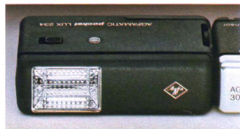
Agfamatik pocket Lux 234 u. 560. Die Elektronenblitzer für die gesamte pocket-Serie.

bis in die tiefe Nacht (1/1000 bis 15 sec.). Das lichtstarke vierlinsige Objektiv bringt höchste Abbildungsschärfe.