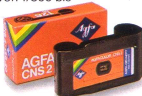
Der Agfacolor CNS-Film für Kassetten 126.