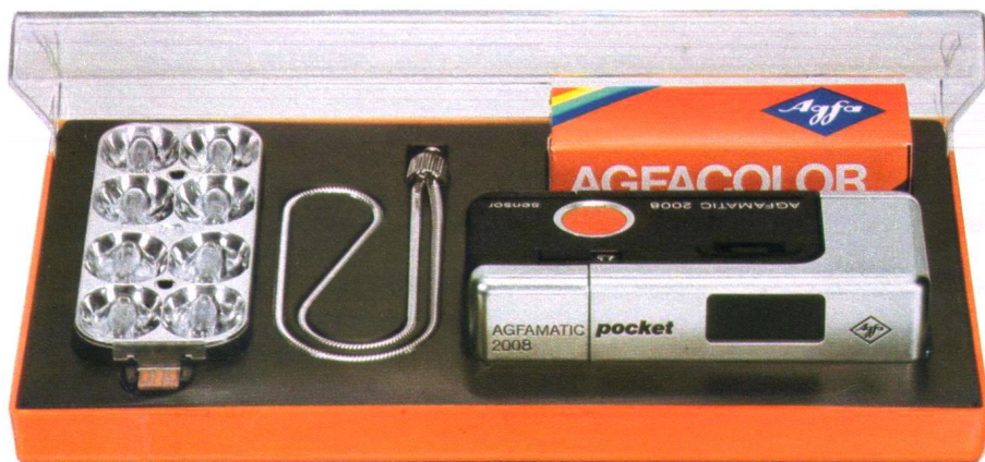
Agfamatic 2008 Geschenkpackung

Agfamatic 2008 tele pocket Die Kamera mit den 2 Objektiven. Normal und tele. Wenn Sie nicht nah heran können oder wollen – einfach auf tele umschalten. Auf Knopfdruck springt das Motiv heran.